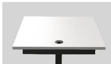
Kabeldurchlass Ø 6 cm