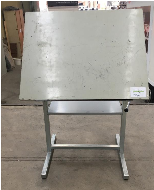
(Beispiel Zeichnungstisch, Referenz Kanton Zürich)