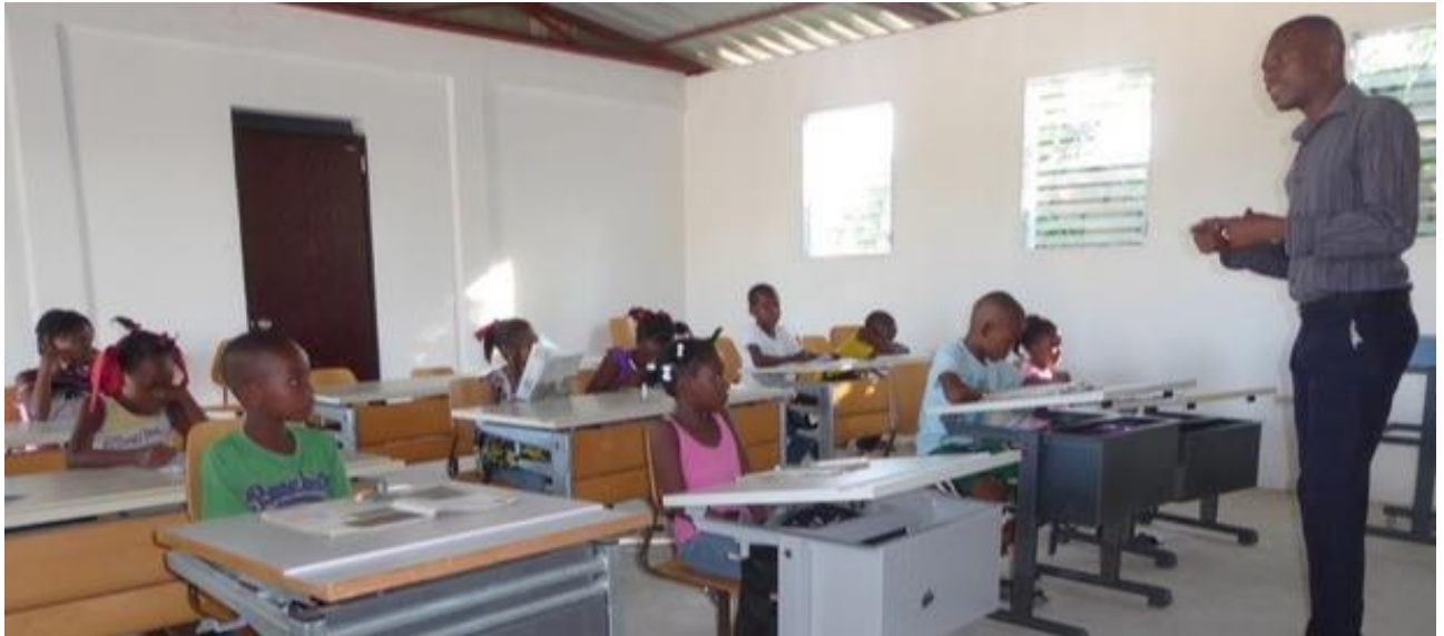
(Schule in Haiti mit Schulmobiliar von mobil Werke)

Unsere qualitativ hochwertigen Schulmöbel haben eine lange Lebenszeit. In Schweizer Schulen ausrangierte Schulmöbel haben meistens schon weit über 10 Jahre Verwendung hinter sich und sind in anderen Teilen der Welt noch sehr willkommen. Unser Fokus in der Konstruktion und Produktion liegt unter anderem in der Langlebigkeit der Produkte auch aus ökologischen Gründen. Daher können alte Schulmöbel von uns zurückgenommen werden und in ausländischen Schulen mit grosser Freude wieder verwendet.